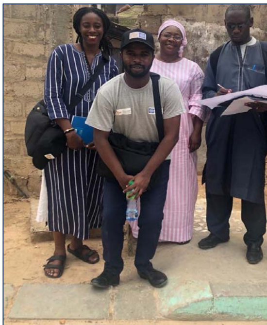
Figure 3: Mission de supervision du dénombrement à Dakar