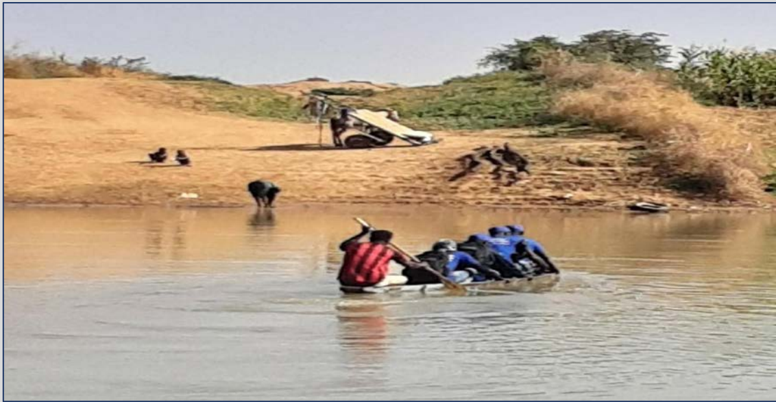
Figure 5: Déplacement des enquêteurs vers un village difficile d'accès

des DR tirés avait aussi été très éprouvant en raison de la longue durée nécessaire pour y accéder et de l'agitation de la mer en cette période.