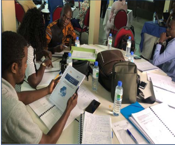
Figure 1: Séance de formation des enquêteurs